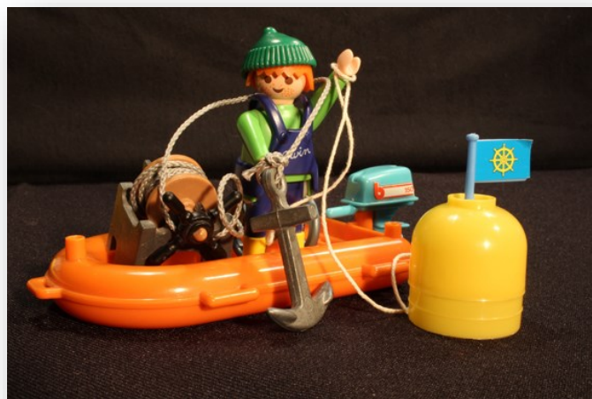
Szenenbild aus dem Musikvideo „Bojenleger vom Bodensee“

(oder einfach bei YouTube oder Facebook nach „Binnensegler“ suchen, da gibt's noch mehr von mir)