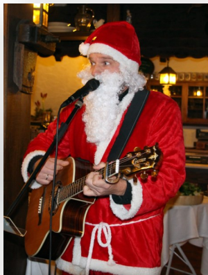
„Binnensegler“-Nikolaus beim Weinheimer Wassersportclub/ Jahresabschluss 2015